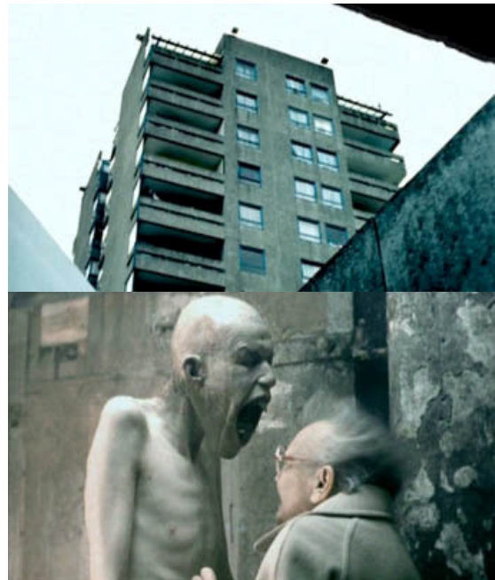
[Aphex Twin - Come to Daddy]

Le plus illustre exemple reste Come to Daddy , stylé dans sa composition comme dans le choix chromatique, il affiche notamment une critique caustique de l'influence de la TV sur l'esprit (surtout des jeunes) : aliénation et uniformisation sont au programme.