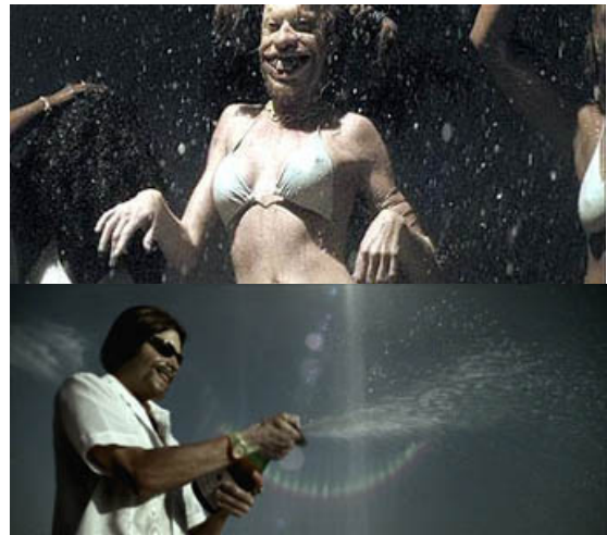
[Aphex Twin - Windowlicker]

Le clip Windowlicker excelle par son association de la musique originale d'Aphex Twin (basée ici sur des sons tirés de vidéos pornographiques) et d'une incroyable parodie des clips de rap américains saturés en "poufiasses"/potiches. Il est bien évidemment incrusté de connotations à caractères sexuels (thème oblige), le tout gravitant autour de l'égoïsme du personnage représentant Aphex Twin. Un vrai pavé dans la marre des clips clichés du genre.