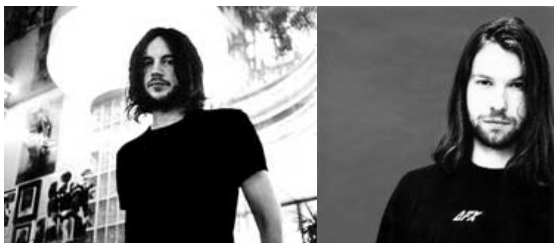
[Chris Cunningham / Aphex Twin]

Ami du compositeur Aphex Twin, spécialiste en musiques électroniques saturées voire saccadées au possible, ils collaborèrent dans plusieurs clips.