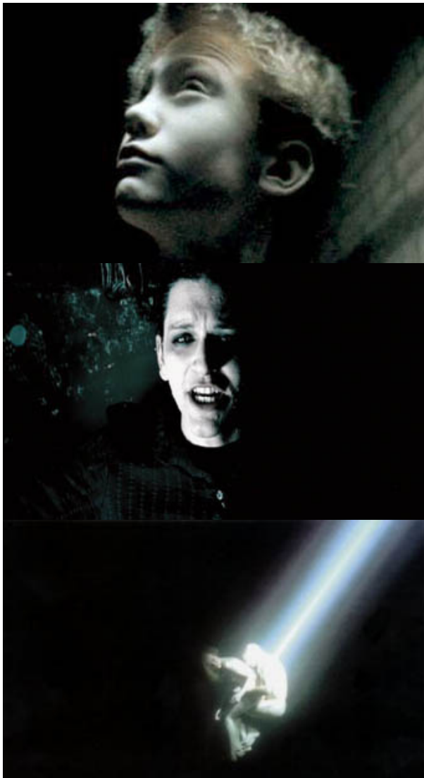
[Portishead - Only You / Placebo - 36 degrees / Ch. Cunn. – Flex ]

Cunningham tourne parfois en milieu sous-marin ; on peut le remarquer dans le clip de Portishead : Only You , 36 degrees de Placebo et le concept Flex d'un esthétisme rarement égalé.