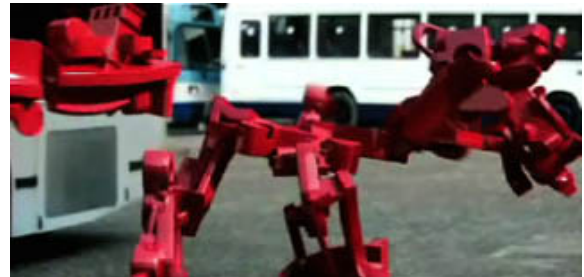
[Publicité PSP 2005]

Point de vue actualité : il assista dernièrement Alex Rutterford dans la création de la publicité pour la PSP qui a sûrement dû titiller votre œil aiguisé de geek.